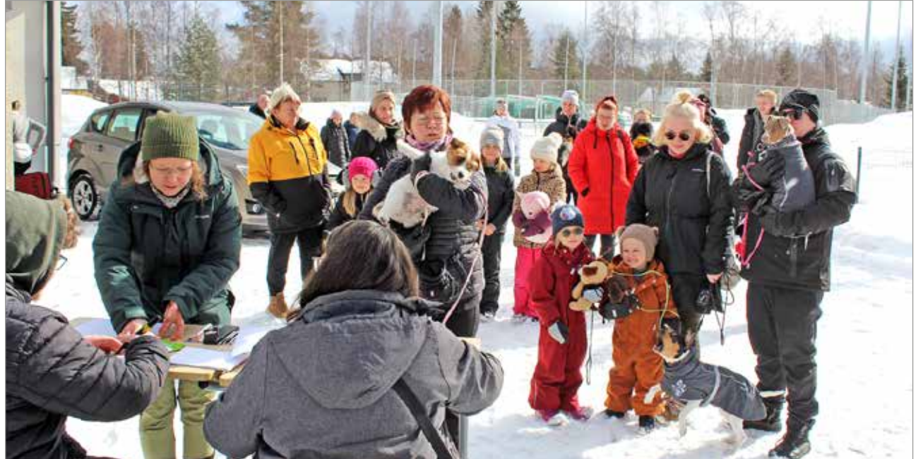
Match Shown ilmoittautumiseen syntyi pitkä jono heti messujen aluksi. Kuva vuoden 2024 messuilta.